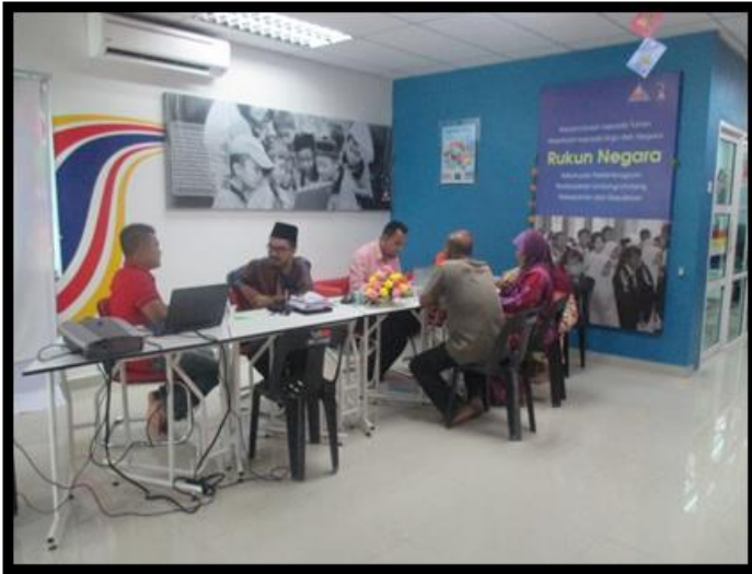
Sesi soal jawab antara komuniti dan pegawai MAIDAM