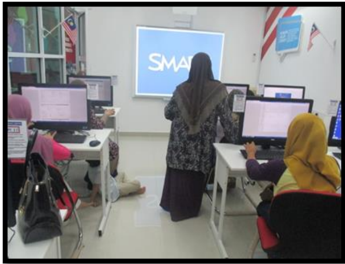
Sesi mengisi borang MAIDAM secara atas talian.