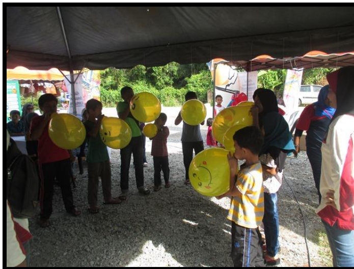
Pertandingan Pecah Belon