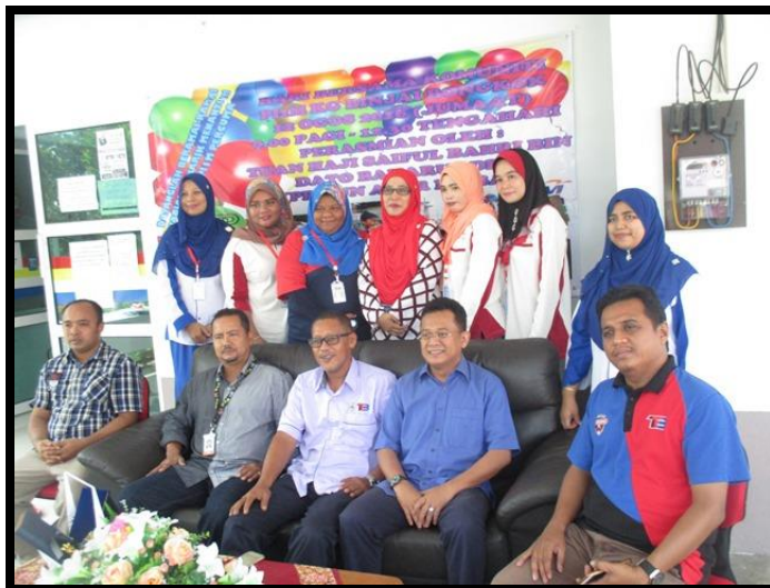
Sesi bergambar bersama Tetamu Kehormat