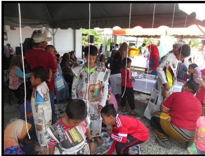
Pertandingan Pakaian Beragam Merdeka