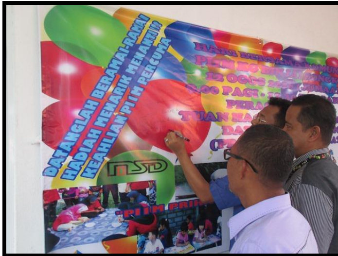
Simbolik perasmian penutup