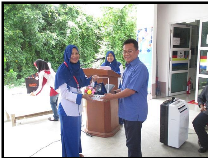
Penyampaian cenderahati kepada Tetamu Kehormat