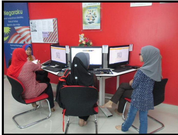
Pertandingan Jejeri Pantas (Dewasa)