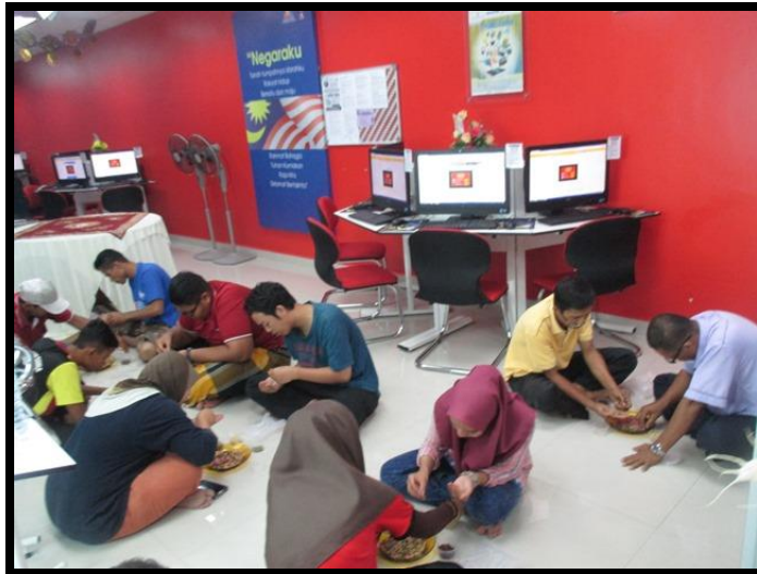
Pertandingan Musang Berjagung