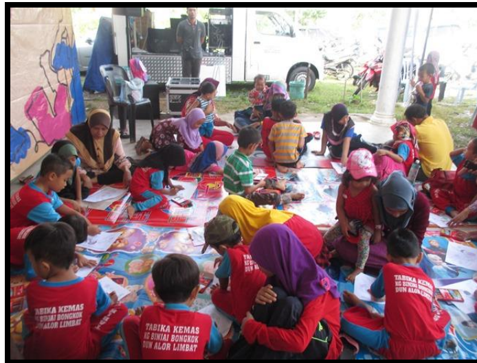
Pertandingan Mewarna (TABIKA)