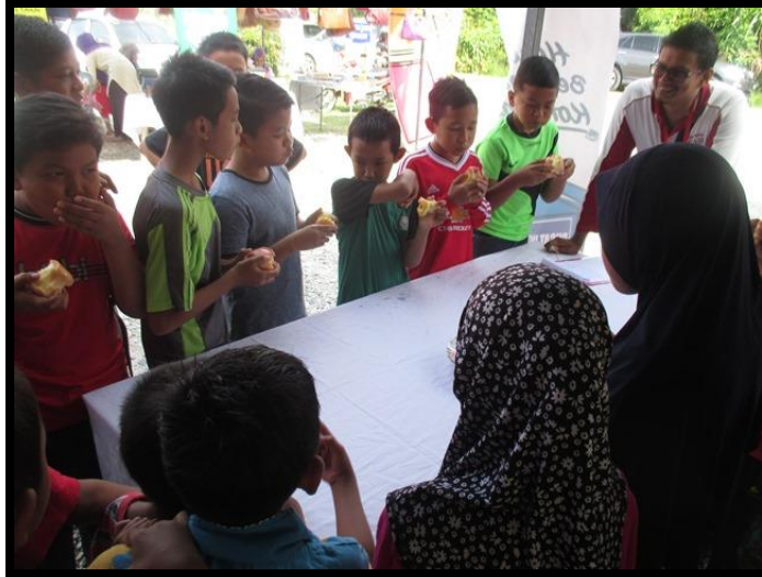
Pertandingan Makan Buah Epal