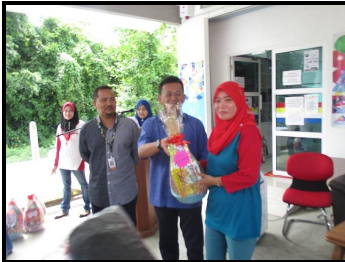
Penyampaian hadiah dan cabutan bertuah